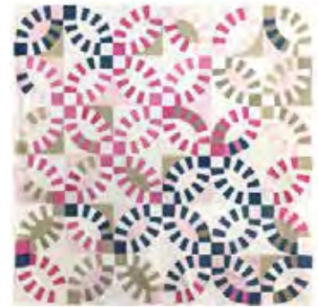
Muestra variación con solo 3 colores