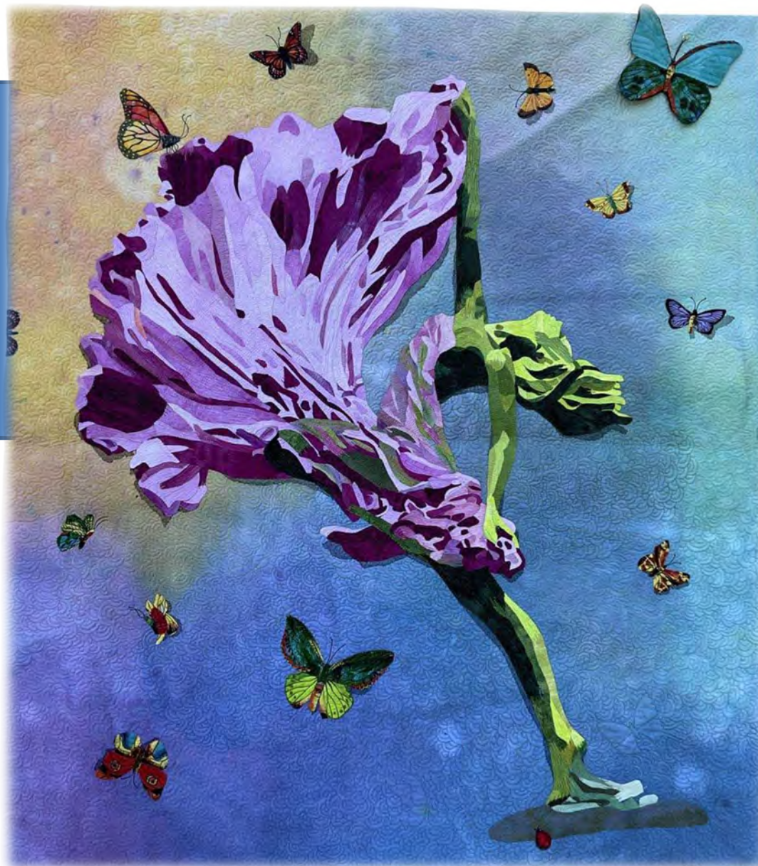
Flora de Inmaculada Gabaldón