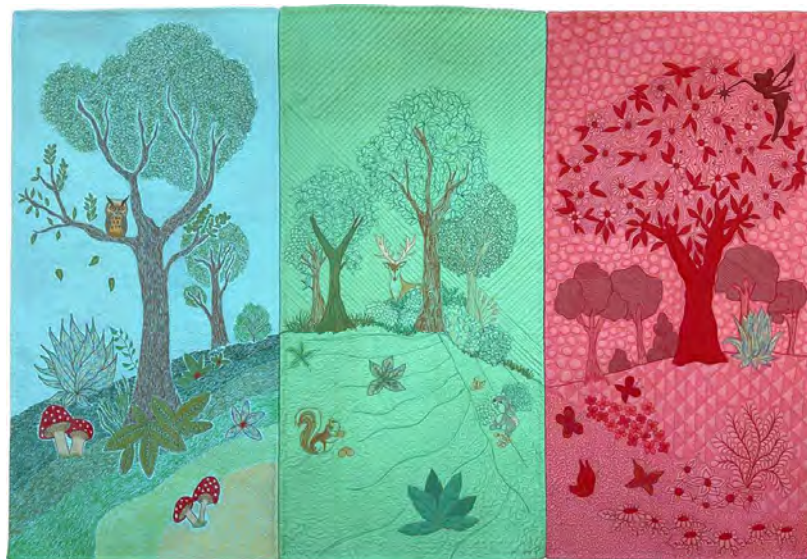
El bosque encantado De J. Bahí, I. Colilles, I. Muñoz