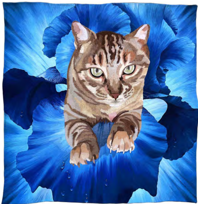
Belleza Salvaje De Judit Gil