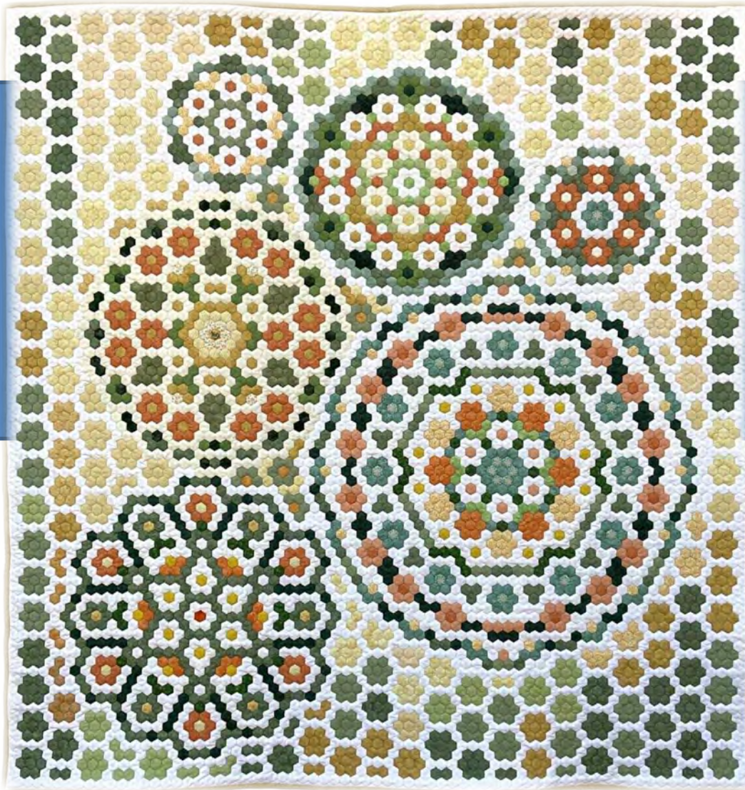
KADO (El camino de las flores) de Carmen M. Cambroner